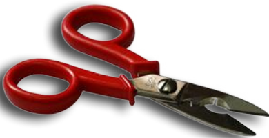
SPECIALI FORBICI SPELACAVI