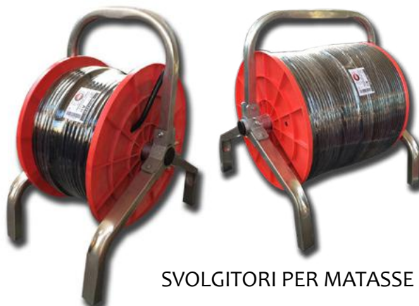
SVOLGITORI PER MATASSE E BOBINE