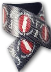
VELCRO ADESIVO RIUTILIZZABILE